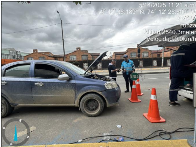
Ilustración No. 3. Operativo pedagógico fuentes móviles.