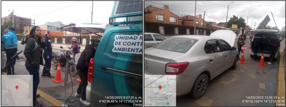
Ilustración No. 1. Operativo pedagógico fuentes móviles.