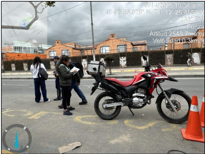
Ilustración No. 2. Operativo pedagógico fuentes móviles.