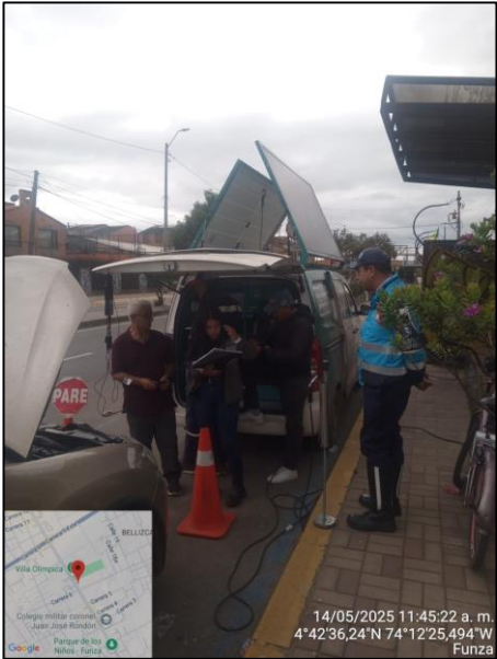
Ilustración No. 4. Operativo pedagógico fuentes móviles.